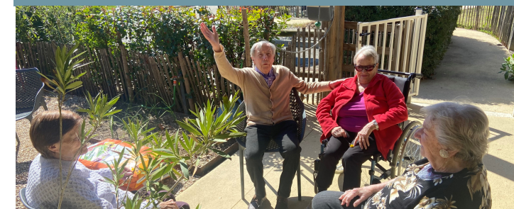
Au service de nos aînés