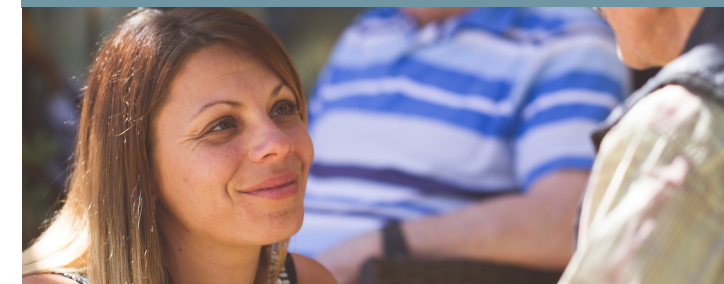
A l'écoute de vos besoins